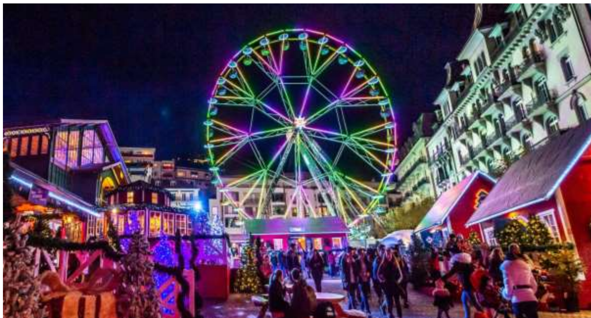
Marché de Noël Montreux