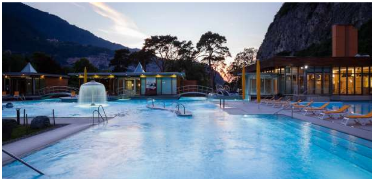
Les Bains de Lavey